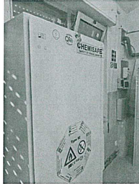
Armadio con chiave