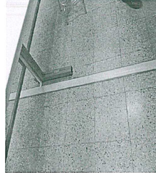
Cavi e canaline sistemate