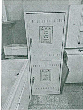
Armadio da non utilizzare